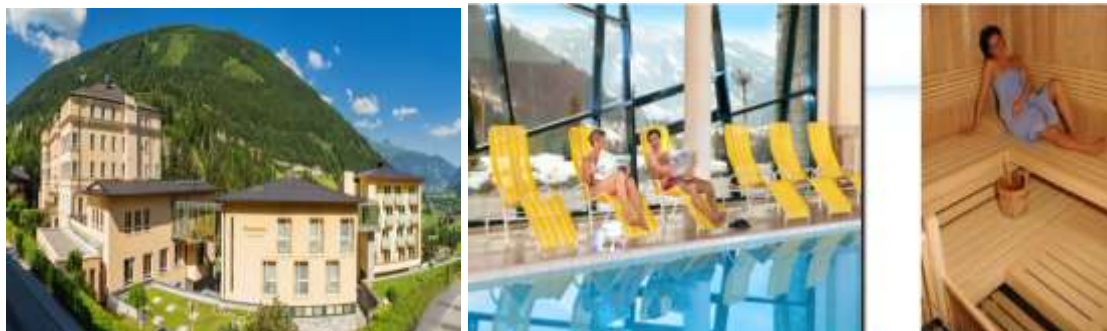
Stiftung Kurtherme Badeospiz Bad Gastein

Stiftung Kurtherme Gesundheits und Felsentherme Bad Gastein nocleh