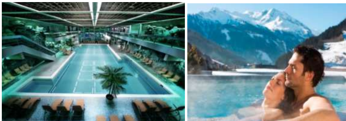
Gesundheits und Felsentherme